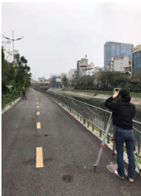
(a) Đo bằng TĐĐT

Trên khu vực thực nghiệm, lựa chọn 100 điểm chi tiết đặc trưng dọc theo sông Tô Lịch, bao gồm: các điểm địa vật rõ nét, ở các vị trí thông thoáng thuận tiện cho đo CORS như: mép đường, mép vỉa hè, mép sông... và các điểm ở các vị trí đặc biệt như dưới tán cây to, góc nhà, gần các trạm điện... có đặc điểm chung là gây khó khăn trong quá trình thu tín hiệu đo CORS.