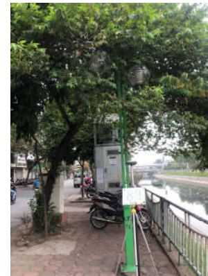
(b) Đo bằng CORS